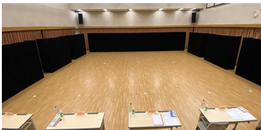
相片為未鋪設地膠，比賽當日將設有舞台地膠